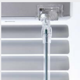
Ultrawand – vinkla och lås persiennen i ett.