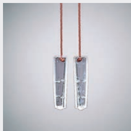
Delbar linknopp – en viktig säkerhetsdetalj för barn och husdjur