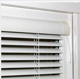
Designlisten integrerar persiennen med fönstret