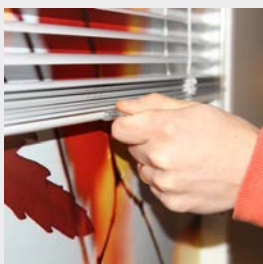
Handmanövrerad med handtag för upp och nerhissning.